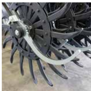
Защита от камней на каждую звезду