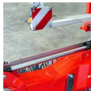
Предупредительный знак с подсветкой